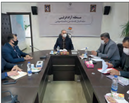
در نشست مدیرعامل کشتیرانی دریایی خزر با دکتر روزبهان؛

همچنین ایشان در خصوص اقدامات صورت گرفته در بخش دریایی افزودند: در بخش دریایی نیز اقداماتی از جمله اطلاع‌رسانی کلیه دستورالعمل‌ها، هماهنگی با سایر نهادها و ارگان‌های دریانوردی، تهیه کیت‌های تست کرونا، ممنوعیت الحاق خانواده دریانوردان به شناورها، کنترل درخواست جانشین دریانوردان شاغل بر روی کشتی‌ها، پاسخگویی به پرسنل شناورها و خانواده آنان در زمینه شرایط حاکم بر شناورها، استفاده حداکثری از پرسنل حاضر بر روی کشتی‌ها در مواقع اضطراری، کنترل ارسال گزارش دمای بدن دریانوردان، ثبت اطلاعات موارد ابتلا به ویروس کرونا دریانوردان و خانواده ایشان، صورت پذیرفته است.